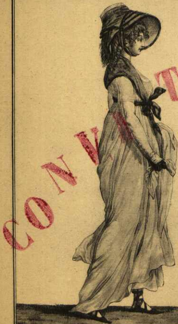
fichu bordé, à pointes saillantes, posé de côté, sur un Chapeau de Paille blanche Manches longues, sans doublure.